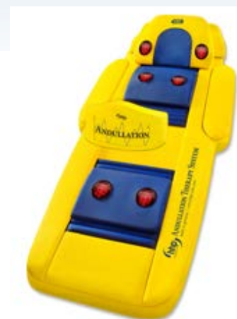
Объект исследования: Терпевтическая система hhp.

В связи с этим повышенное накопление именно абдоминального жира является большим фактором риска для развития сахарного диабета, нарушения толерантности к глюкозе, гиперинсулинемии, артериальной гипертензии, онкологических заболеваний, артритов, синдрома склеро-кистозных яичников и многих других патологических состояний; кроме того, при ожирении у женщин повышается продукция яичниками и корой надпочечников мужских половых гормонов, вследствие чего развивается гирсутизм, а также нарушение менструальной функции.