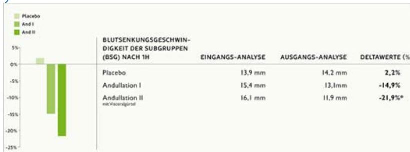
Рис.2. Результаты анализа крови СОЭ по трем группам испытуемых.

Данные скорости оседания эритроцитов (СОЭ) по анализам трех групп приведены в таблице 2