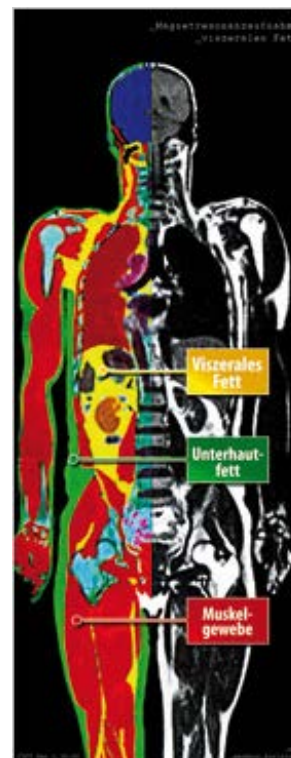
Рис. 1 Магнитно-резонансная томография жировых отложений.

В значениях уровня HDL-холестерина - результаты еще лучше . Хотя Placebo показывает незначительное снижение этого параметра (-2,6%), в обеих группах с применением андуляционной терапии регистрируются значительные изменения уровня HDL-холестерина (+8,1% – +14,7%). При использовании андуляционного пояса эти изменения проявились еще больше. Рост хорошего HDL-холестерина оптимизирует соотношение LDL /HDL и тем самым улучшает липидный обмен.